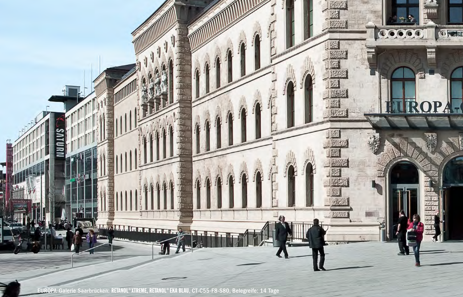
EUROPA-Galerie Saarbrücken: RETANOL®XTREME, RETANOL® EKA BLAU, CT-C55-F8-S80, Belegreife: 14 Tage

Die beschleunigte Erhärtung von Retanol® Xtreme/ Xtreme Pro 1/Xtreme Pro 2 ist zu beachten.